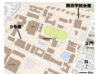
関西学院大学西宮上ヶ原キャンパス