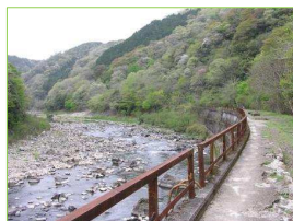
JR 廃線跡ハイキング道