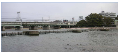
阪神 武庫川駅南 潮止め堰